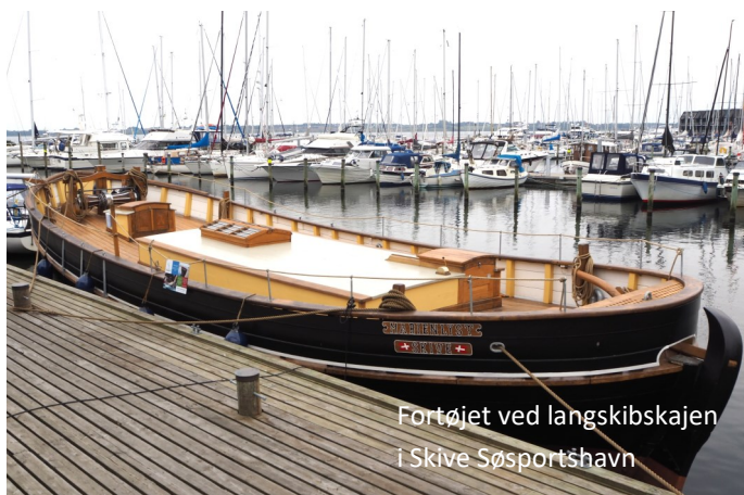
Fortøjet ved langskibskajen i Skive Søsportshavn

Har du lyst, er der mulighed for at blive aktiv med maritim håndværk og sømandsskab. Dels på vores store skib, Marienlyst og dels omkring jollerne.