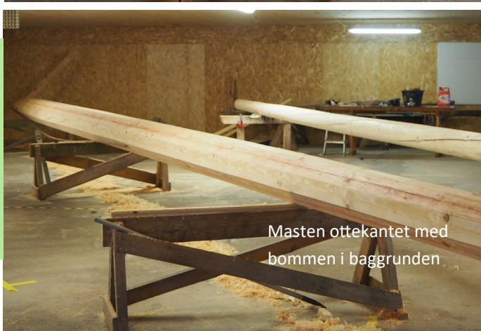
Masten ottekantet med bommen i baggrunden