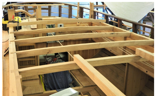
Bjælker til ruftag