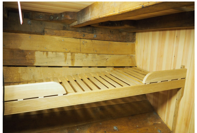
Køje i forreste lugaf