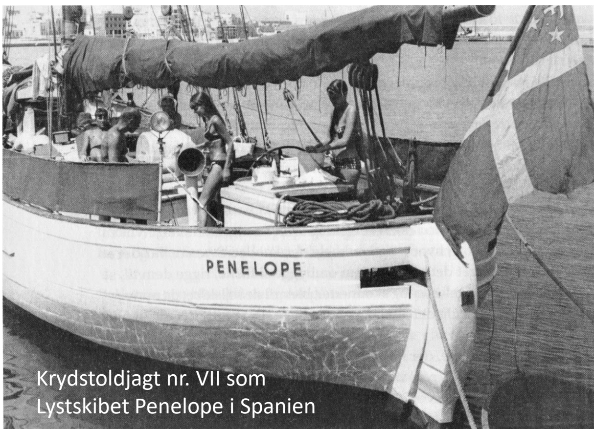
Krydstoldjagt nr. VII som Lystskibet Penelope i Spanien