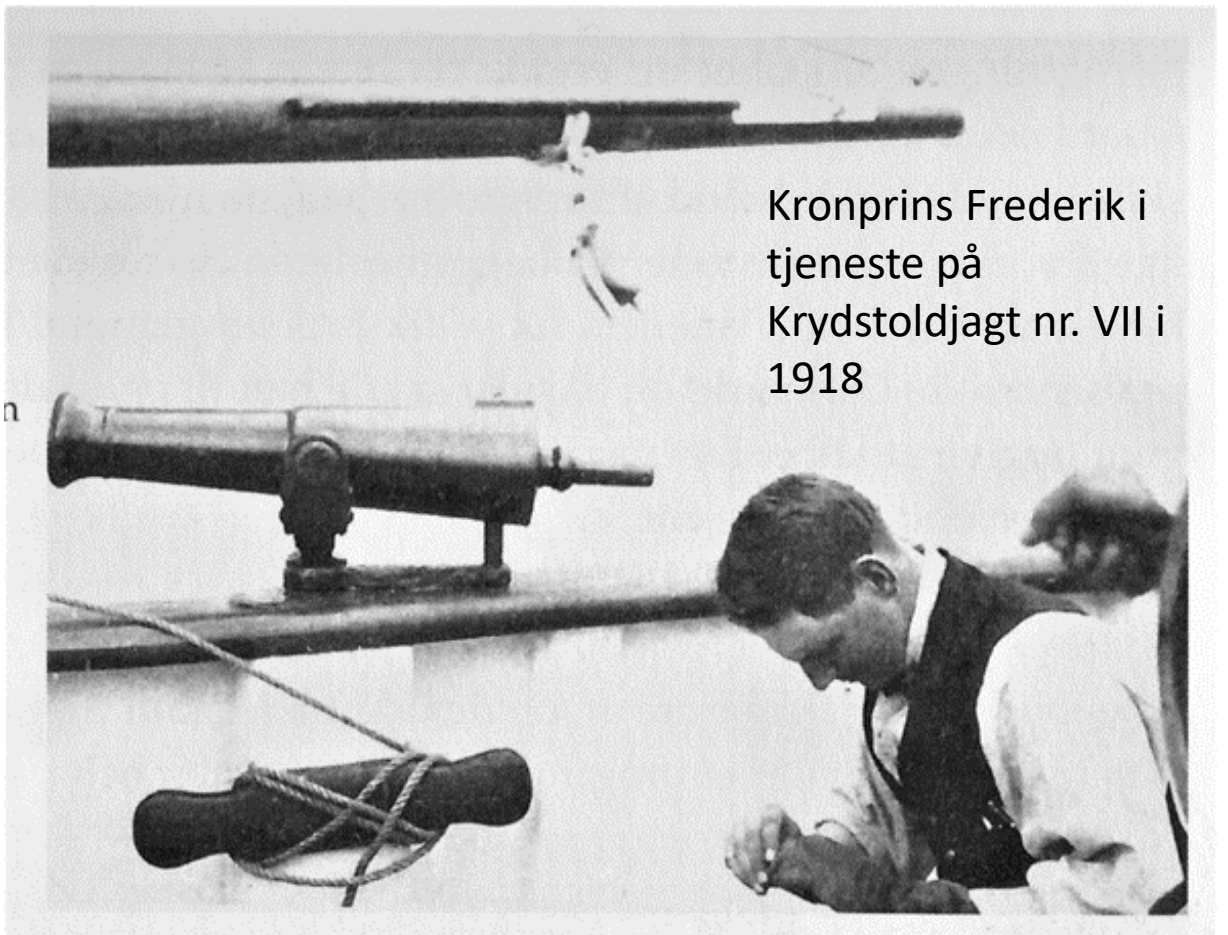
Kronprins Frederik i tjeneste på Krydstoldjagt nr. VII i 1918