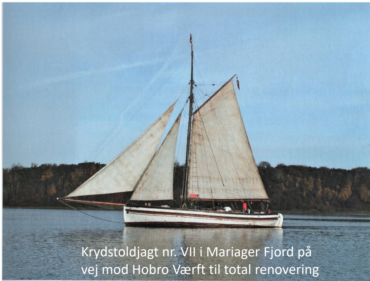
Krydstoldjagt nr. VII i Mariager Fjord på vej mod Hobro Værft til total renovering