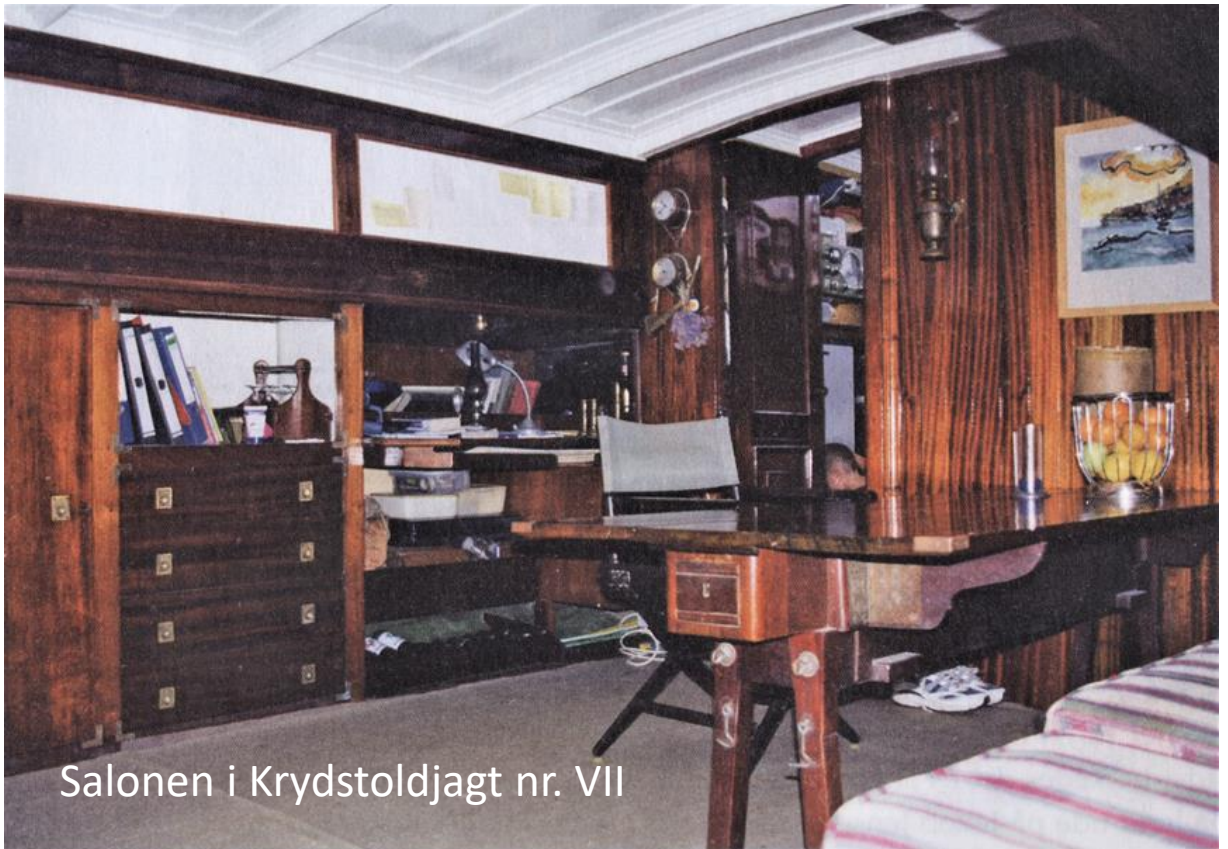
Salonen i Krydstoldjagt nr. VII